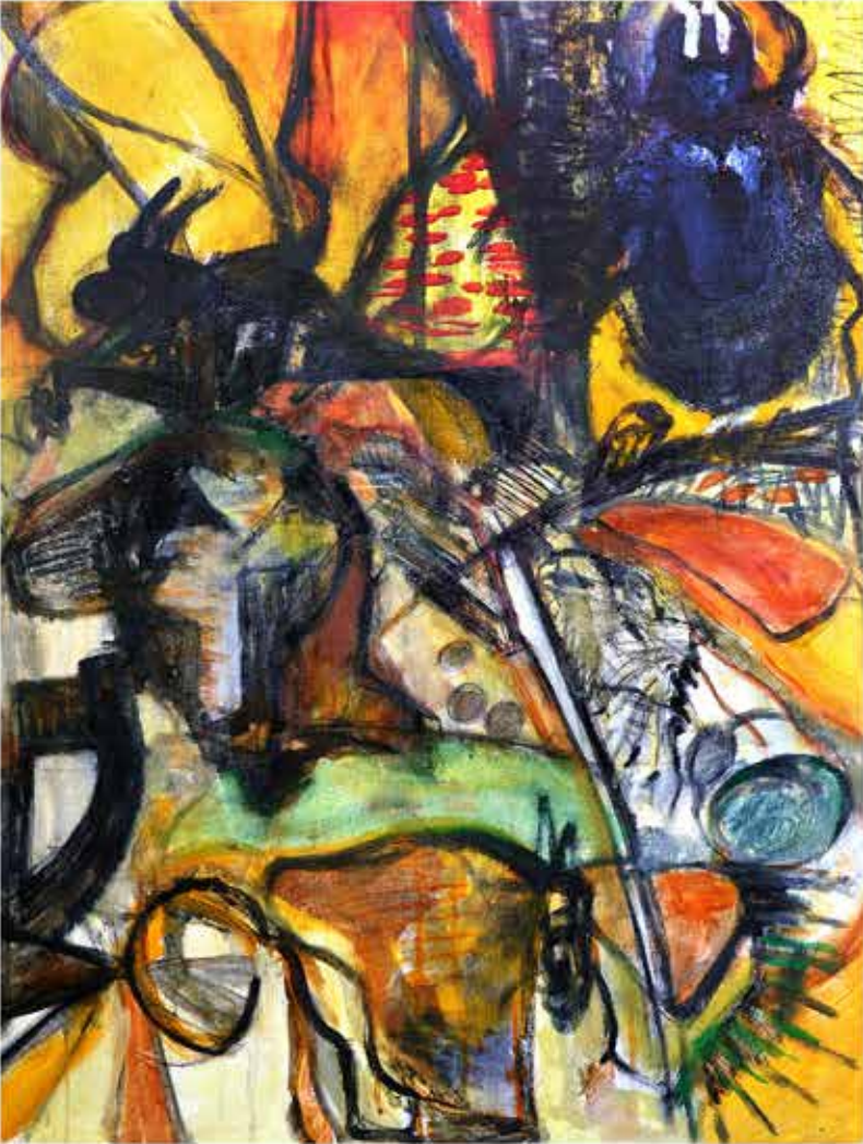
Consortio , 80x60 cms., 2015. Temple/tela.