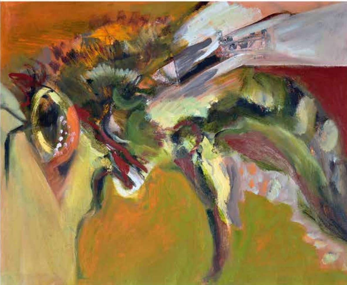
Abeja , 40x50 cms., 2015. Óleo/tela.

De acuerdo con Eduardo Correa, se define como violencia intrafamiliar el acto de poder u omisión recurrente, intencional o cíclico, con el que se domina, somete, controla o agrede física, verbal, psicoemocional o sexualmente a cualquier miembro de la familia, dentro o fuera de su domicilio, situación en la que existe algún parentesco entre los involucrados (Prevención de violencia intrafamiliar). En México casi la mitad de las mujeres mayores de 15 años son o han sido víctimas de violencia intrafamiliar, sea como pareja, madres o hijas y, en la gran mayoría de los casos, son los hombres los que ejercen violencia física, psicológica o económica en contra de ellas. La violencia es el resultado de la frustración, la impotencia, la inseguridad, la falta de autoestima, el resentimiento... y estos sentimientos subyacen en el acto violento, aun cuando sea provocado por el alcohol, la cultura del "machismo" o cualquier otro pretexto. La violencia es un grave síntoma del malestar, a nivel personal y/o social.