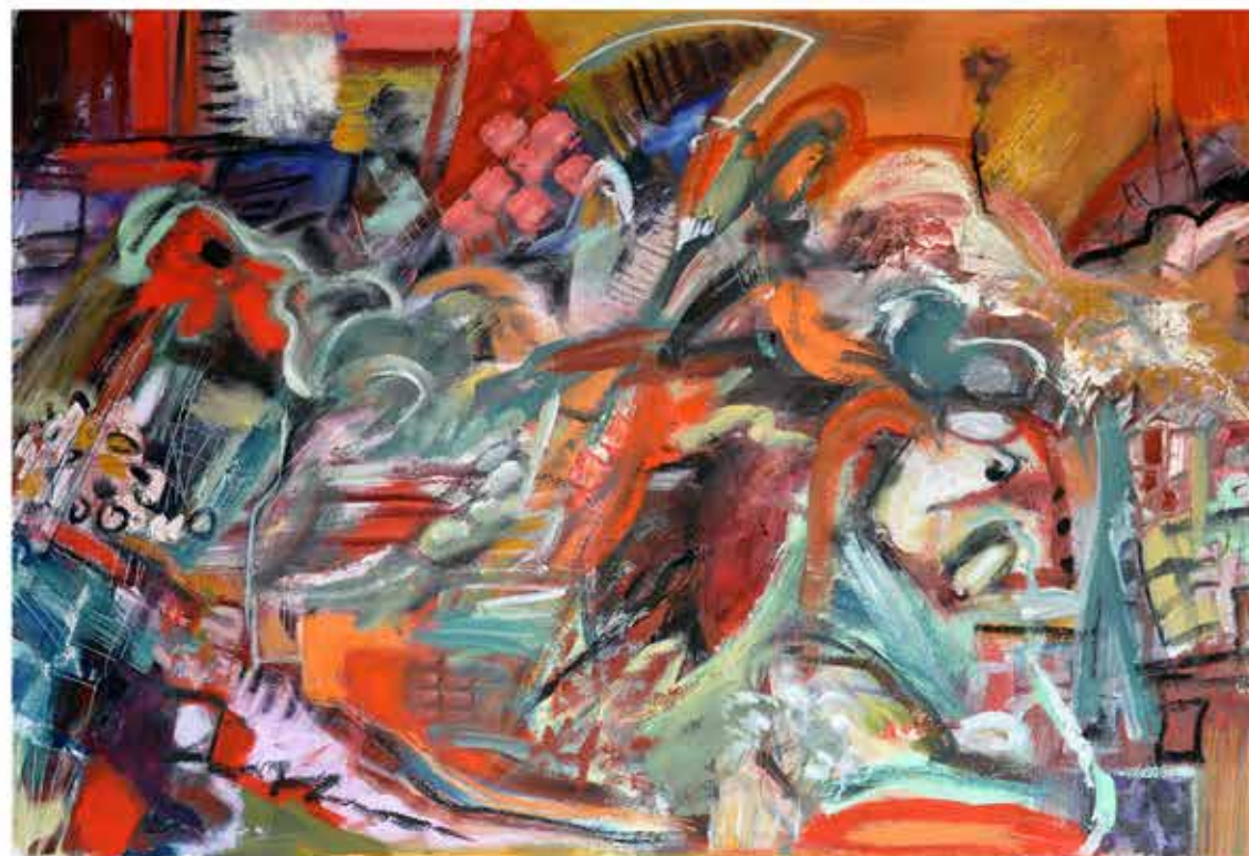
La fiesta , 80x120 cms., 2015. Óleo/tela.