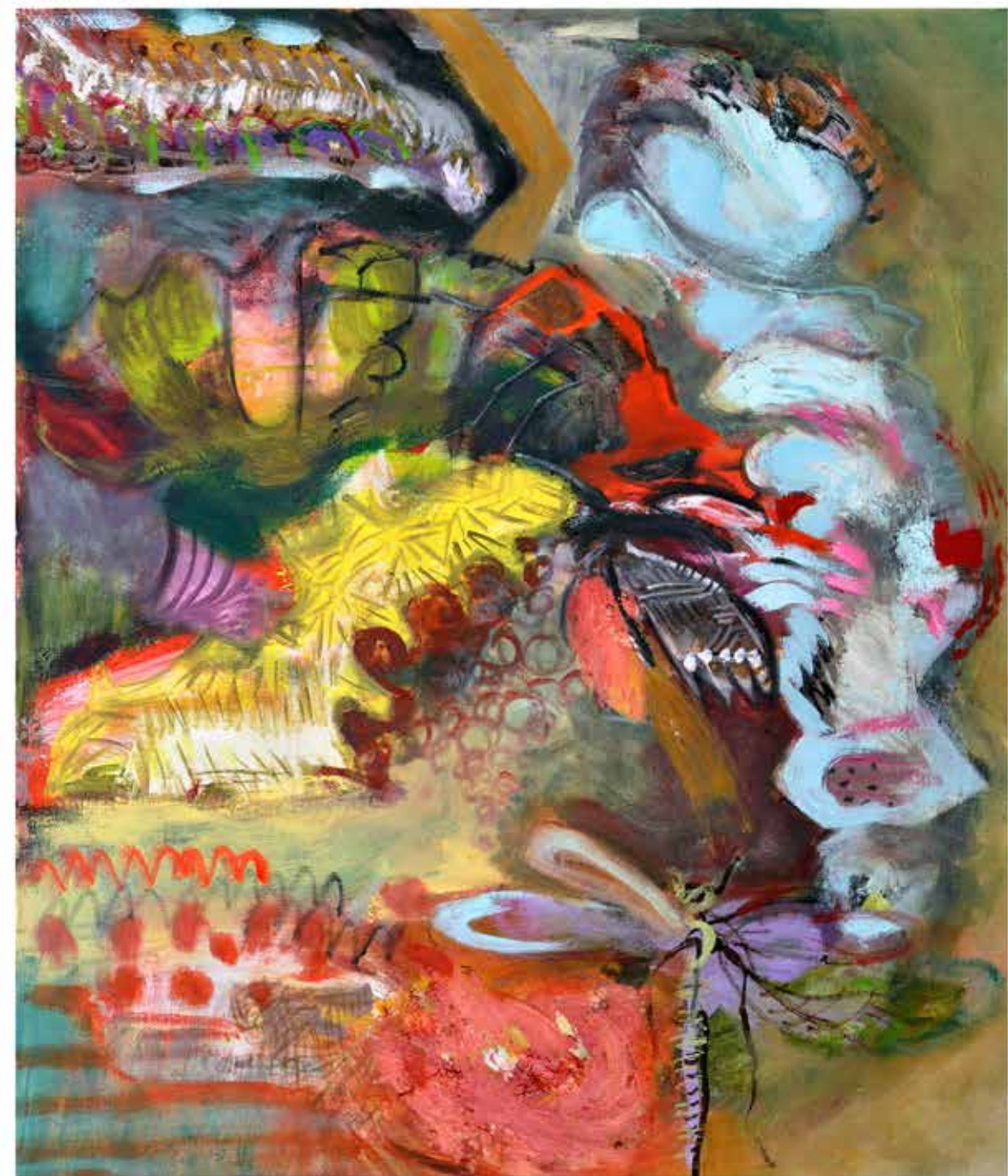
Capullo , 80x70 cms., 2015. Óleo/tela.