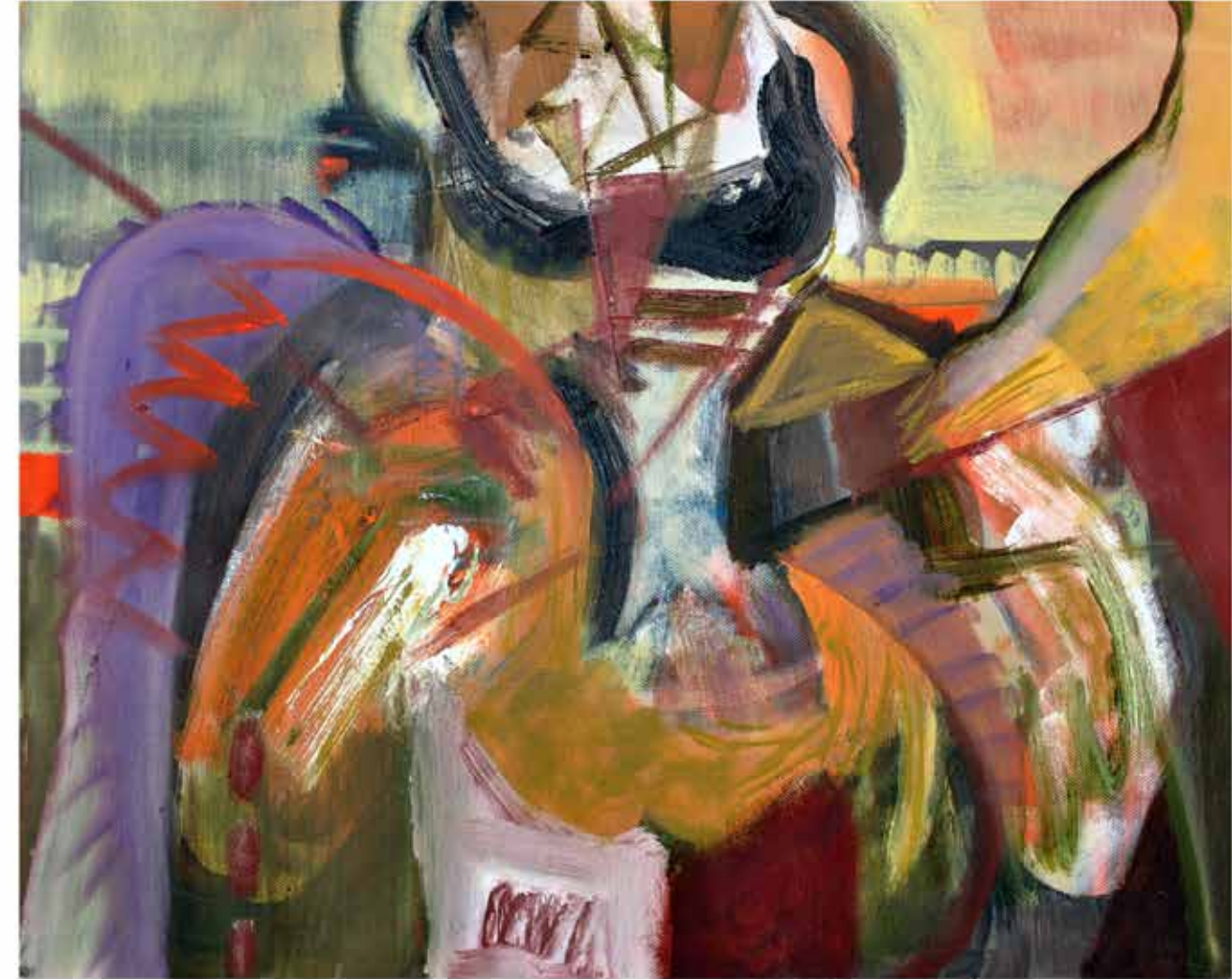
Escarabajo , 40x50 cms., 2015. Óleo/tela.

La compleja problemática de la violencia genera además una conducta igualmente grave por parte de las víctimas: el silencio. La realidad del fenómeno queda así "disimulada", sepultada, inclusive justificada, por sentimientos de culpa, miedo, impotencia. La exposición pictórica de Alicia Amador traduce, desde su título, el horror y la repulsión que despierta la violencia en la familia, a través de una visión sutil y sarcástica. En los lienzos podemos adivinar los bichos, a veces figurados, y la mayoría de las veces escondidos detrás de los trazos. El talento de la artista logra hacer una propuesta estética de extraordinario colorido, que "invade" cada espacio en forma elocuente y silenciosa. Es exactamente esta la cualidad del arte: hacernos llegar a través de los sentidos y la emoción un discurso en forma directa y sin transición.